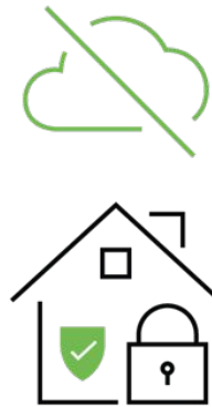
Loxone Smart Homes